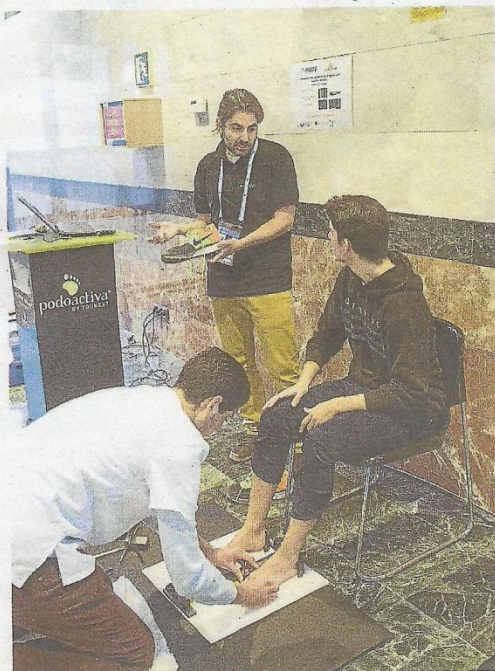
El estudio de la pisada se incluye en los servicios médicos.

El arranque del patinaje de velocidad enciende ahora alguna alarma extra dado que los participantes se deslizan sobre el hielo a más de 50 kilómetros por hora. Aunque la pista se haya envuelto con amplias protecciones, la posibilidad de una caída con serias consecuencias es bastante amplia. «En el 'short track' vamos a ver muchas lesiones por traumatismos, pero estamos preparados para lo que vamos a abordar. La Federación Internacional (FISU) obliga a que haya un médico siempre