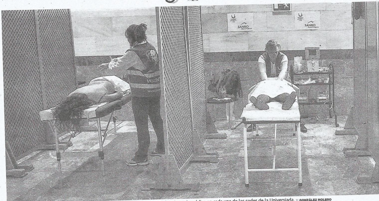
El Palacio de Congresos se ha convertido en el centro neurálgico de una red de asistencia médica en cada una de las sedes de la Universiada. ■ GONZÁLEZ MOLERO