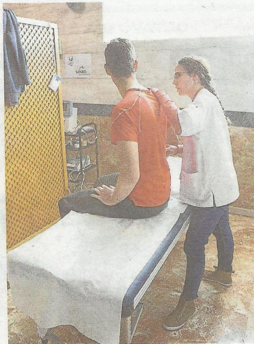
Los deportistas son explorados con tal de detectar dolencias.

ba diagnóstica de algún deportista como emitir una simple receta médica, algo que solo pueden hacer en España los médicos colegiados en nuestro país. «Las delegaciones extranjeras nos piden una receta especial creada para este evento y así se soluciona ese asunto».